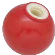
PB -R (无嵌套、红色)