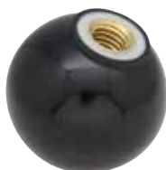
PC -B (带嵌套、黑色)