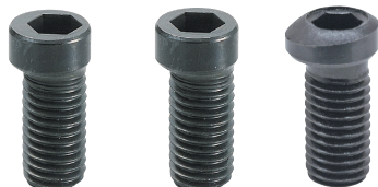
MBCS 04, 16