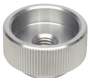
BJ750 -**201N (不锈钢)