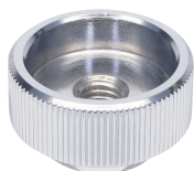
BJ750 -**101N (镀铬)