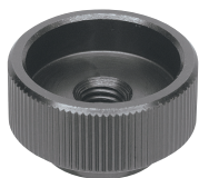
BJ750 -**001N (四氧化三铁膜)